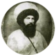
Mustafa Meşhûr @MustafaMes... · 14h