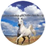
anugun @anugun1993 · 1d