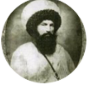
Mustafa Meşhûr @MustafaMeshur